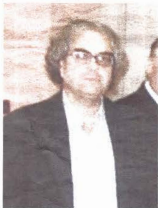
AUTORE Sergio D'Amaro. In alto, «Morning Sun» di Edward Hopper

Scrittura in versi e visualizzazione in immagini pittoriche costituiscono la cornice formale di questo quadro, vero e proprio connubio artistico, in cui la sintesi della visione figurativa, di stampo pressoché fotografico impressionista, si fonde magistralmente con il sentimento struggente di una poesia delicatamente emozionale. Ci si ritrova, pertanto, di fronte ad una lettura visuale, poeticamente di matrice lirico-visiva, che veicola una ben selezionata rassegna, una